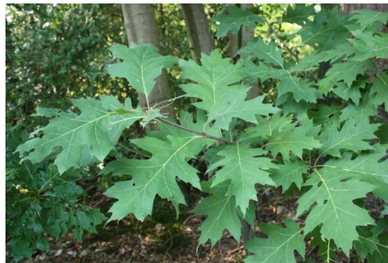
TAK / TWIJG MET BLADEREN