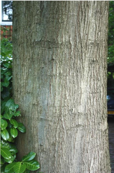
SCHORS VAN DE STAM